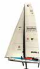
SPIRIT OF HUNGARY