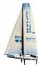
WE ARE WATER