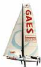
GAES CENTROS AUDITIVOS