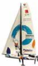
ONE PLANET, ONE OCEAN-PHARMATON